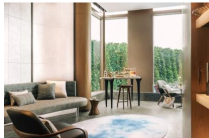
香港逸兰苏豪东服务式公寓

2024 年 5 月 8 日，香港 - 逸兰个性化酒店及公寓（逸兰）欣然宣布，旗下三间酒店及服务式公寓今年一同荣获 Tripadvisor 猫途鹰 2024 年度“旅行者之选大奖”。