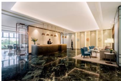
香港麦当劳道贰号