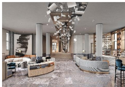
墨尔本逸兰议会花园酒店 — 大堂

逸兰明年会继续其扩展计划，将在澳洲墨尔本推出全新豪华酒店及服务式公寓项目 墨尔本逸兰议会花园酒店 ，体现品牌致力缔造「个人化酒店及公寓」的承诺，在世界各地的黄金地段呈献超卓住宿服务。新酒店将座落于墨尔本中心商务区，俯瞰议会花园，地段优越，拥有 137 间各式客房，包括酒店客房以及一房和两房公寓。